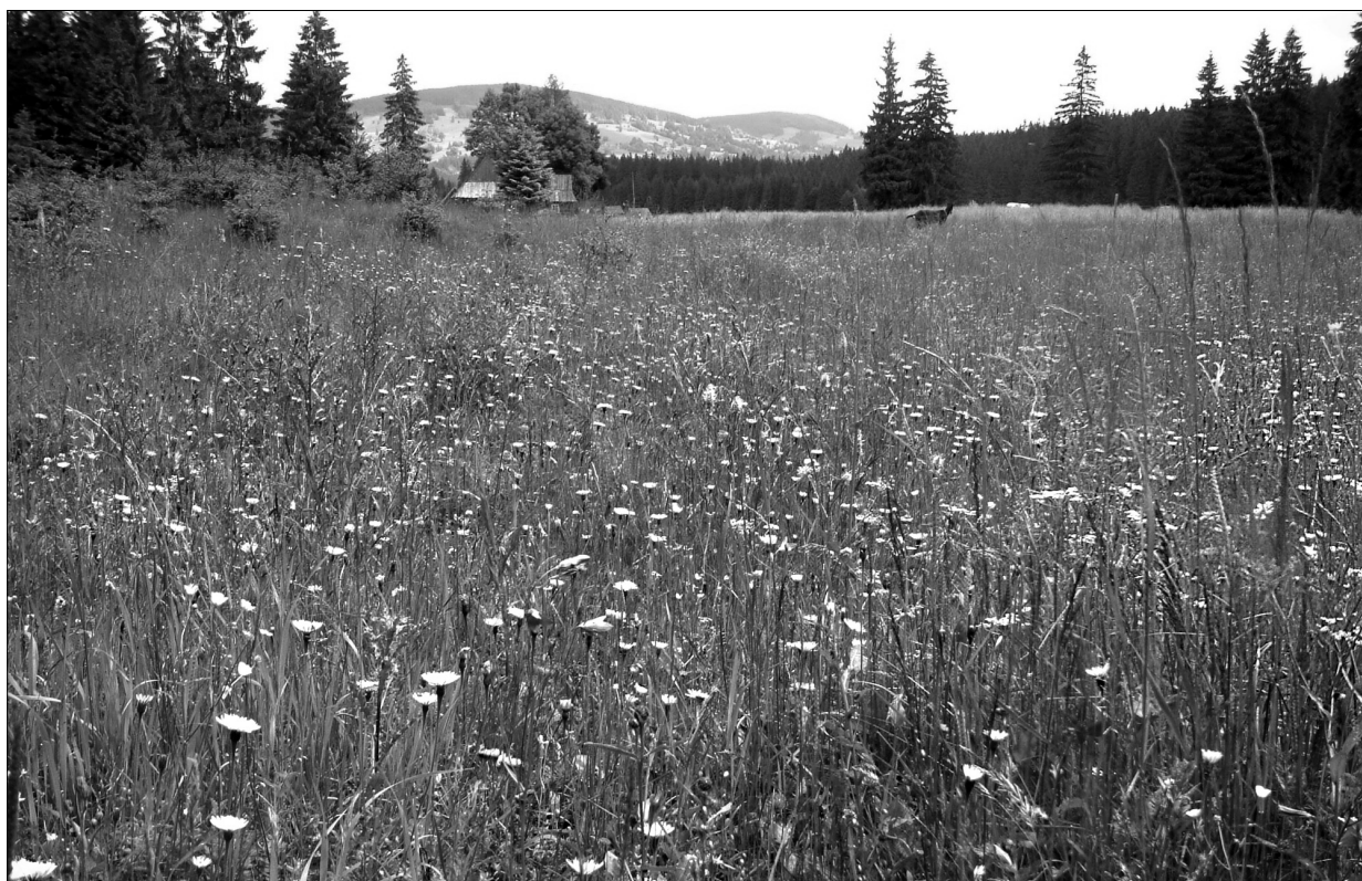
Reglowa łąka mieczykowo-mietlicowa (Tatry).

Mieczyk dachówkowaty Gladiolus imbricatus , mietlica pospolita Agrostis capillaris , krokus spiski Crocus