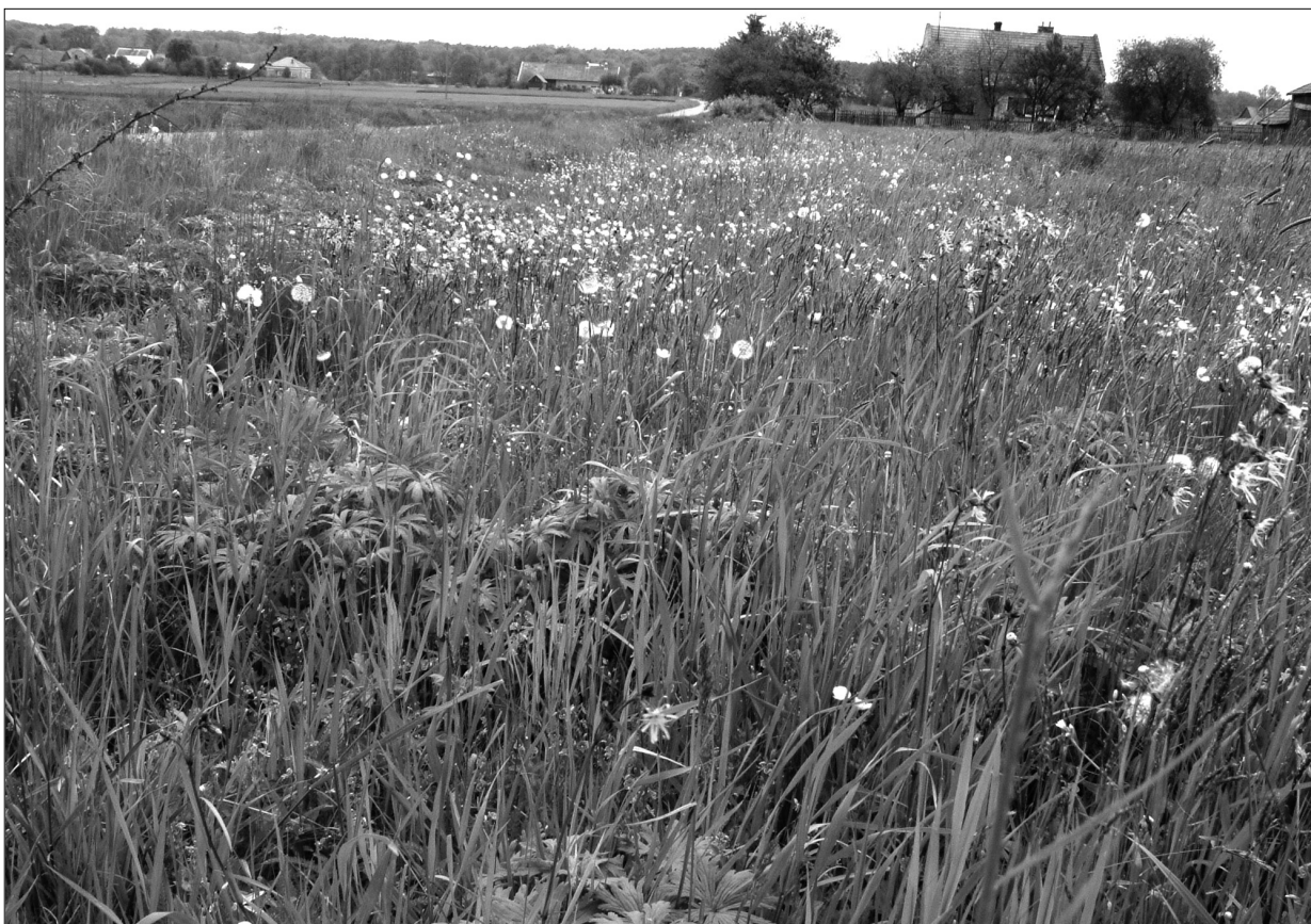
Niżowa łąka użytkowana ekstensywnie. Okolice Bochni.

Łąki z dominacją rajgrasu wyniosłego należą do najcenniejszych florystycznie zbiorowisk łąkowych. Bogatym w gatunki jest podzespół typowy ( Arrhenatheretum elatioris typicum ). Uprzywilejowanymi stanami łąki rajgrasowej są także bogate florystycznie płaty podzespółów z szatwą łąkową ( A. e. salvietosum pratensis ) i stokłosą prostą ( A. e. brometosum erecti ), w których notuje się interesujące gatunki ciepłolubnych muraw: kłosownicę pierzastą Brachypodium pinnatum , goździka kartuzka Dianthus carthusianorum , wiązówkę bulwkową Filipendula vulgaris , pierwiosnka lekarskiego Primula veris i inne. Na uwagę zasługują bardzo bogate florystycznie łąki rajgrasowe z przywrotnikami ( A. e. alchemilletosum ) charakteryzujące się także dużym zróżnicowaniem gatunkowym.